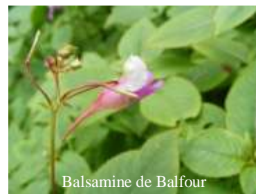
Balsamine de Balfour

Fleurs : bicolores, avec à l'arrière un éperon allongé.