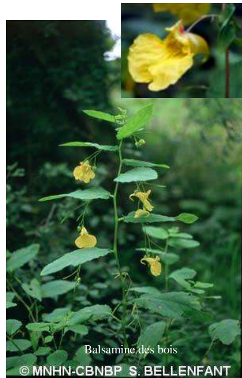
Balsamine des bois

Fleurs : jaunes, mesurant 2 à 3 cm. Eperon fortement recourbé.